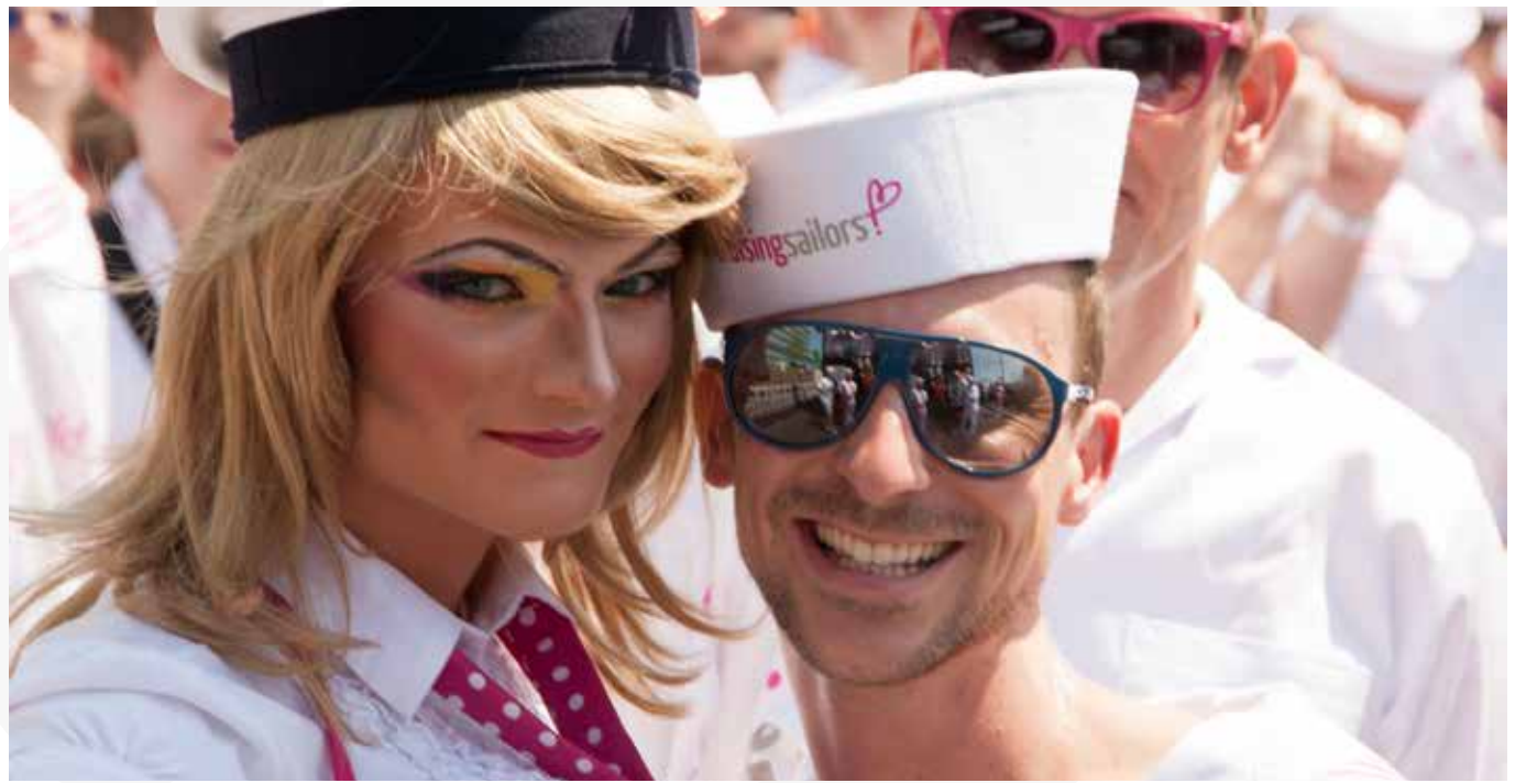
Cruising Sailors, CSD Köln, 2013