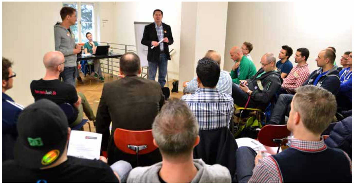
Runder Tisch kreathiv –präventiv 2014, Köln