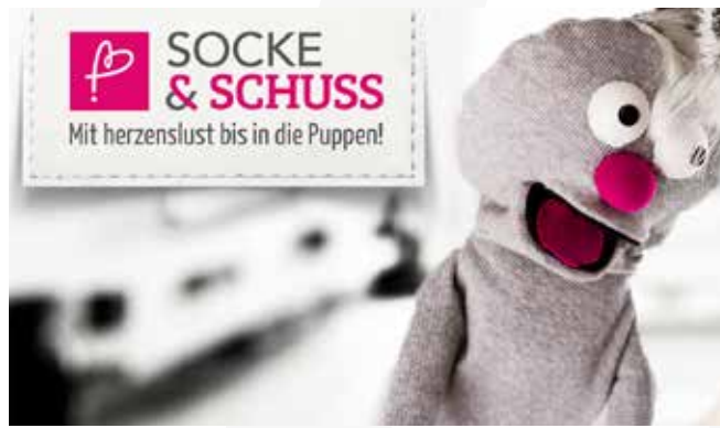
Socke & Schuss, 2015

Patrick Dörfler: Wir schauen uns ganz genau an, auf welche Themen die Leute anspringen und auf welche weniger. Die Redaktionsplanung wird immer wieder angepasst, um die Reichweite zu erhalten und auszubauen.