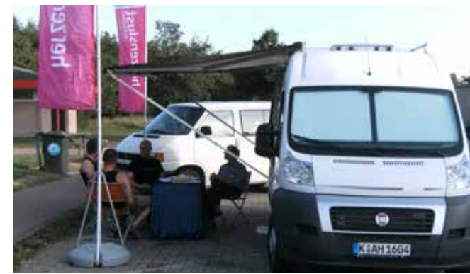
Beratung und Test, Duisburg / Kreis Wesel, 2009

Martin Ocepek: Das sind die vielfältigen Angebote, Spieleabende, Gruppen für schwule Väter wie für Menschen mit einer körperlichen Behinderung, für die älteren Schwulen oder für Schwule über 30. Das Café [iks] und das Essen-X-Point sind Bindeglieder zur