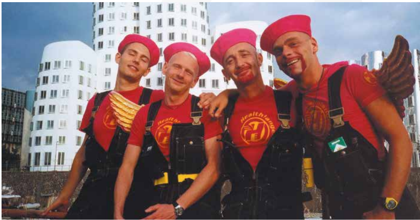
Healthlangels, 2003, Düsseldorf