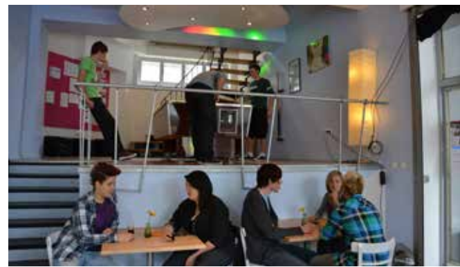
anyway Köln, 2011

Dann bekam das Kölner Jugendzentrum anyway als erstes seine eigenen Räume. Heute gibt es zahlreiche Jugendzentren, die