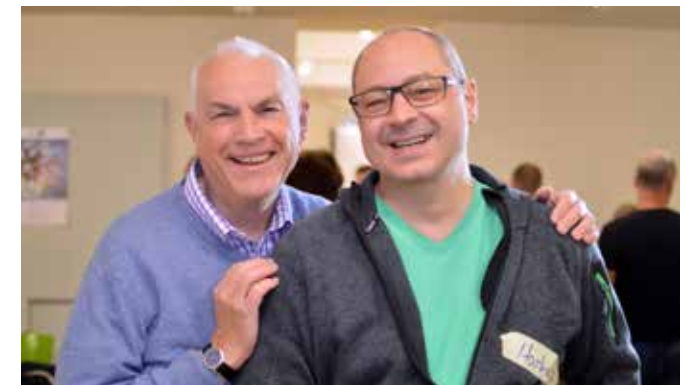
Runder Tisch kreathiv – präventiv 2014, Köln