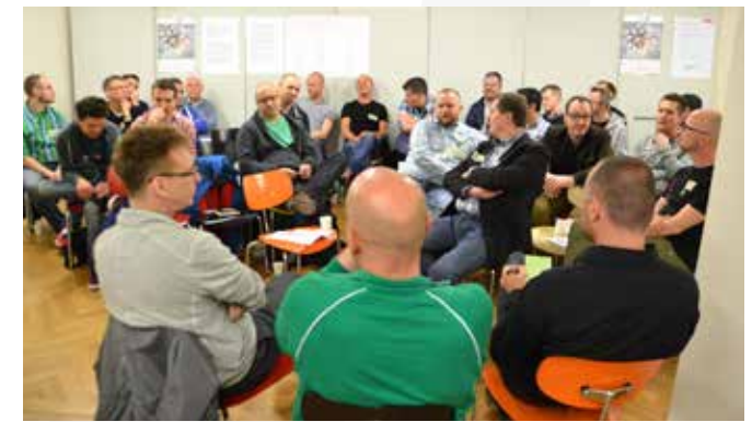
Runder Tisch kreathiv – präventhiv 2014, Köln