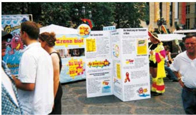
Die Szene bist du, 2001

Ich fordere von der Politik inhaltliche und finanzielle Bekenntnisse zur Herzenslust-Arbeit. Wie entwickeln wir kultursensible Angebote oder wie erreichen wir schwule Männer, die beim Sex Drogen konsumieren, sind aktuelle Fragen der Prävention. Wir müssen von der Politik geeignete Rahmenbedingungen erhalten, um diesen Herausforderungen mit aller Qualität begegnen zu können.