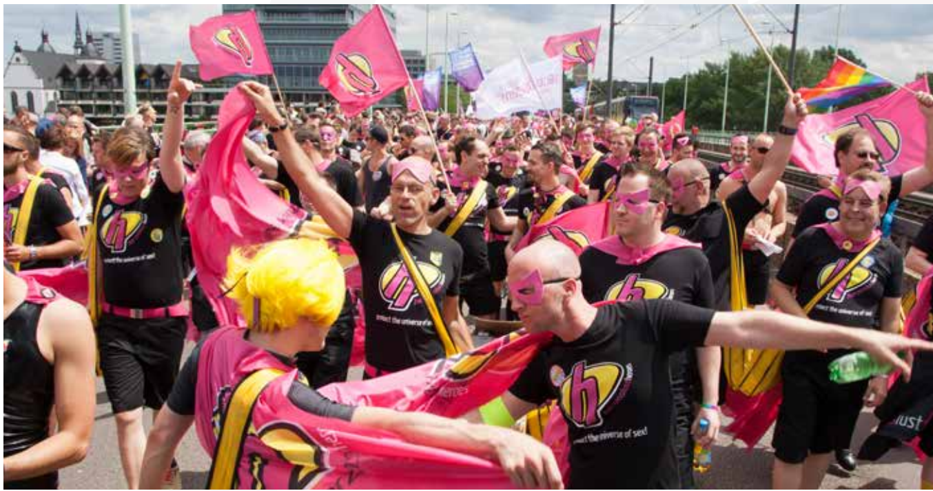
Herzenslust-Heroes, CSD Köln, 2014

Aber vor allem sind es in Köln die schwule Gesundheitsagentur Check Up (seit 01.01.2015 der neue CHECKPOINT 2015 ) der Aidshilfe Köln, die Beratungsstelle Rubicon und das Jugendzentrum anyway , die kontinuierlich und das ganze Jahr über in dieser Großstadt mit Herzenslust im Einsatz sind. Die ehren- und hauptamtlichen Mitarbeiter des Herzenslust-Teams von Check Up sind in der schwulen Szene bekannt. Sie sind in Bars ebenso wie in der Sauna, im Fetischclub oder in den Cruisinggebieten unterwegs und bringen ihre Präventionsthemen ohne erhobenen Zeigefinger an den Mann. Mit humorvollen Aktionen und hin und wieder auch in auffälligen Outfits werben sie um die Aufmerksamkeit der Gäste und setzen Impulse, sich mit Fragen zur eigenen sexuellen Gesundheit zu befassen. Die Mischung macht es eben: Eine gelungene Kombination aus Präventainment und kompetenter Beratung zu schwulem Leben und aktuellen Themen und Fragen der Prävention von HIV und anderen STI ist der Garant für die erfolgreiche Arbeit.