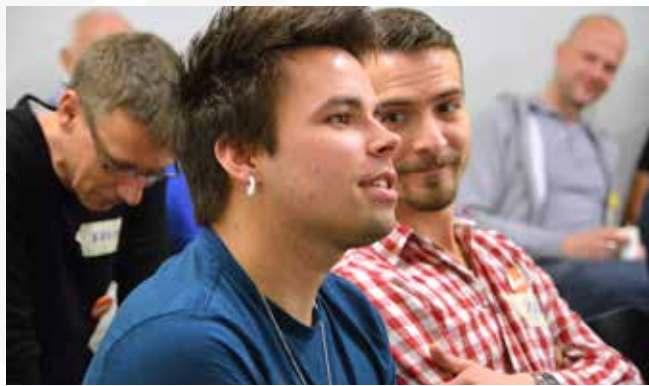
Runder Tisch kreathiv – präventhiv 2014, Köln