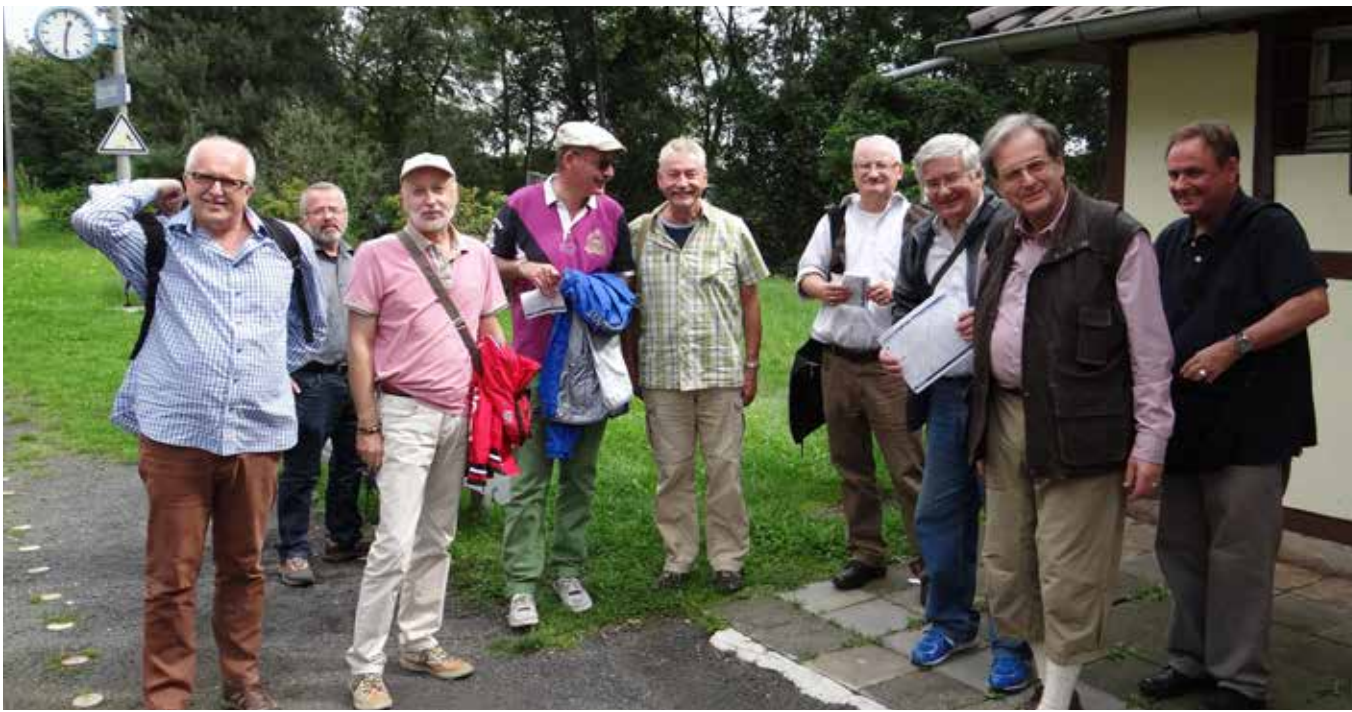
Golden Gays, 2014, Ahrweiler

Die daraus resultierenden Themen und relevanten Aufgaben sind vielfältig. Zum einen ist die Sensibilisierung ambulanter und stationärer Pflege sowie Betreuung für unterschiedliche Lebensformen, sexuelle Vielfalt oder Leben mit HIV dringend erforderlich. Aber auch die Unterstützung der Bildung sozialer Netzwerke der schwulen Community, die einen würdevollen Umgang mit Krankheit, Pflege und Tod ermöglichen, darf nicht vernachlässigt werden und der Dialog zwischen jüngeren und älteren schwulen Männern muss gefördert werden. Ebenso müssen die politischen, gesellschaftlichen und finanziellen Rahmenbedingungen geschaffen werden, die dies unter Beachtung der Besonderheiten schwuler Lebenswelten ermöglichen.