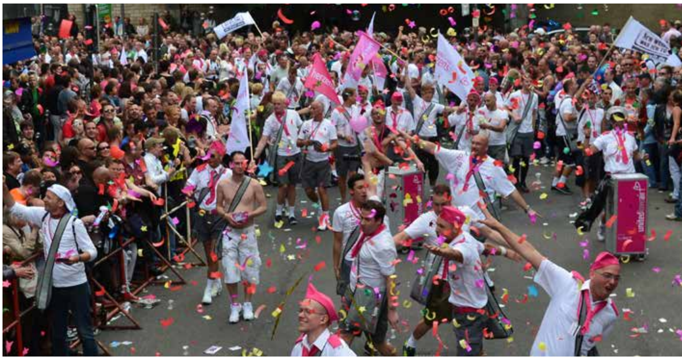
United Love Air, CSD Köln, 2011