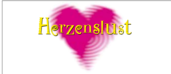
Herzenslust-Logo 1995 – 2008

Die erste Homepage ging 1997 online. Im Jahr 2004 erfolgte der erste Relaunch der Website herzenslust.de . Hier wurden die Themen und Inhalte des Herzenslust-Onlineprojekts Rein ins Vergnügen wieder in den Onlineauftritt der Kampagne integriert. Im Rahmen des Kampagnenrelaunchs 2008 wurde auch die Internetpräsenz neu konzipiert. Der gesamte Bereich der Onlinekommunikation wird kontinuierlich erweitert und ausgebaut, sei es mit dem Onlinenewsletter von Herzenslust oder den unterschiedlichen Facebookprofilen der Kampagne.