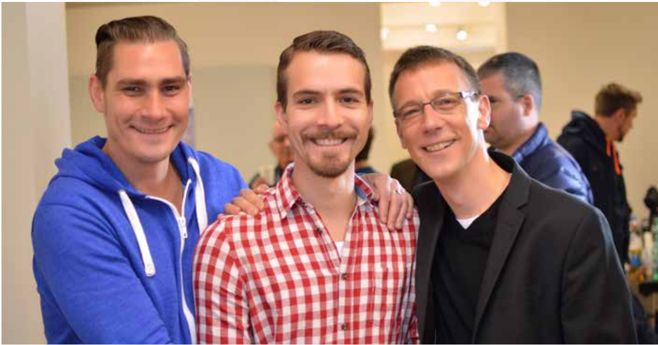
Runder Tisch kreathiv – präventiv 2014, Köln

Da Safer Sex heute weit über die Frage der Benutzung von Kondomen hinausgeht, wird Präventionsarbeit beratungsintensiver werden, die Nutzung verschiedener Informationskanäle aufwendiger und auch die Zusammenarbeit mit weiteren Akteuren im Feld schwuler Selbstorganisation und schwuler Gesundheit differenzierter. Gemeinsam arbeiten wir auch künftig gegen Diskriminierung, Stigmatisierung und Kriminalisierung. So dürfen etwa HIV-Positive auch in Zukunft keineswegs als Präventionsversager gebrandmarkt werden. Es gilt, die komplexeren Präventionsbotschaften auch weiterhin auf eine Weise zu kommunizieren, die neugierig und Lust auf die persönliche Reflexion eigenen Verhaltens macht.