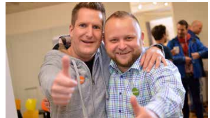
Runder Tisch kreathiv – präventiv 2014, Köln