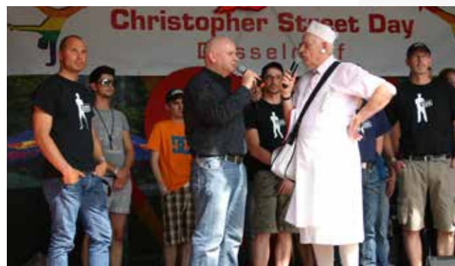
CSD Düsseldorf, 2010