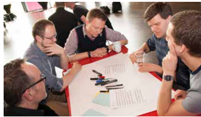
Runder Tisch kreathiv – präventhiv 2013, Köln

Herzenslust fördert die Selbstorganisation und deren Infrastrukturen, Selbstbewusstsein und Akzeptanz der gesellschaft-