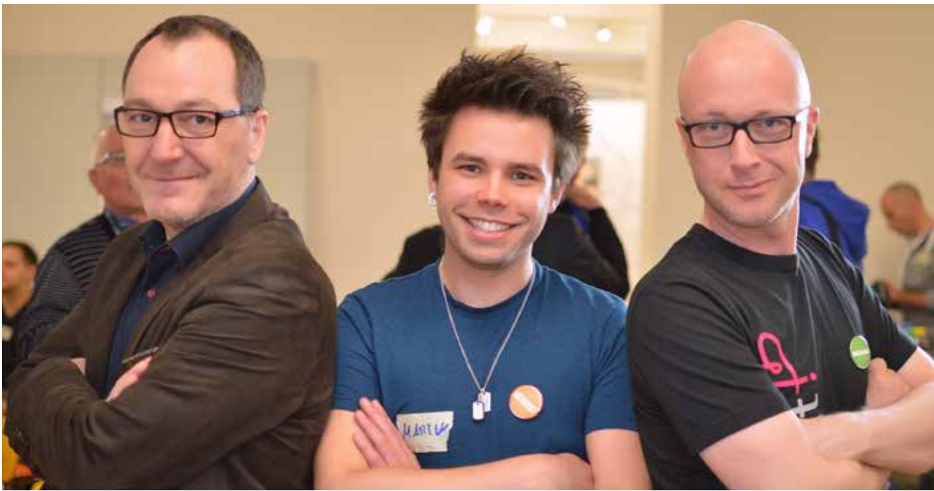
Runder Tisch kreathiv – präventiv 2014, Köln

Herzenslust wird nicht müde, die Politik aufzufordern, sich schwulen Lebensrealitäten zu stellen und diese Lebenswelten auch in ihrer Heterogenität wertzuschätzen. In Zeiten, in denen Stimmen wieder verstärkt Gehör finden, die Homosexualität als Normabweichung brandmarken, braucht es eine besondere Aufmerksamkeit und Sensibilität für eine aktive Minderheitenpolitik.