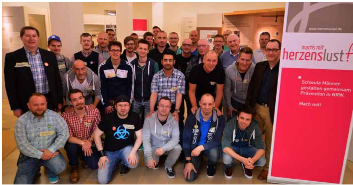
Runder Tisch kreathiv – präventiv 2014, Köln