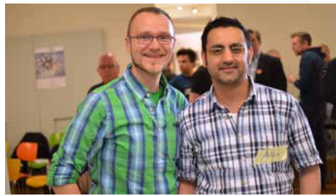
Runder Tisch kreathiv – präventiv, 2014, Köln