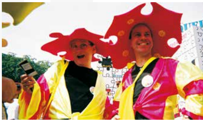
Die Szene bist du, 2001