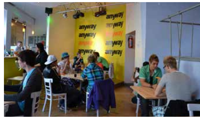
anyway Köln, 2011

Medienprojekte wie die JuPo -Filme (jung und positiv) oder Präventionsspots des anyway wurden aus ZSP-Mitteln mit Herzenslust gefördert. Die Webserie Julian (Junge Liebe anders)