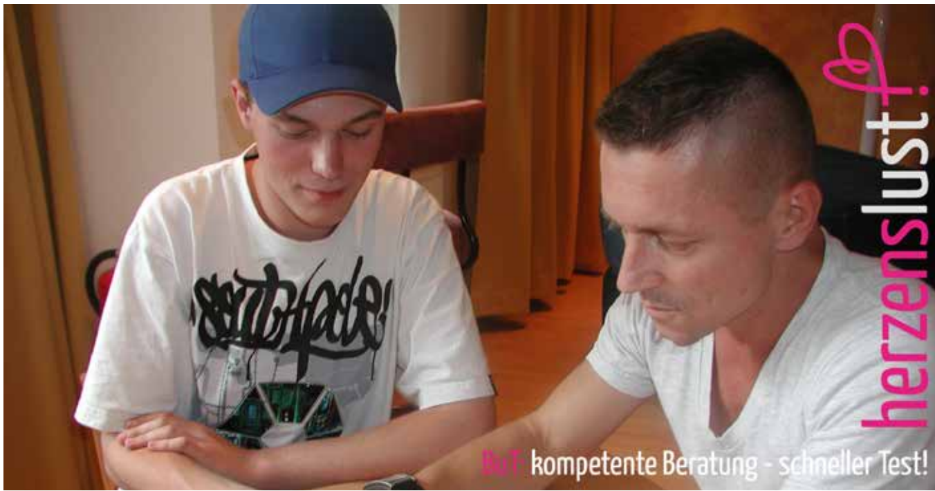
Ankündigung Beratung und Test, 2009

Auch in anderen Städten werden ähnliche Modelle bereits angeboten, werden ausgebaut oder sind in Planung. Ziel ist es, niedrigschwellig der primären Zielgruppe zu allen Fragen der schwulen (Männer-) Gesundheit Informationen, Beratung, Tests auf HIV und andere STI sowie perspektivisch auch medizinische wie therapeutische Behandlung anzubieten.