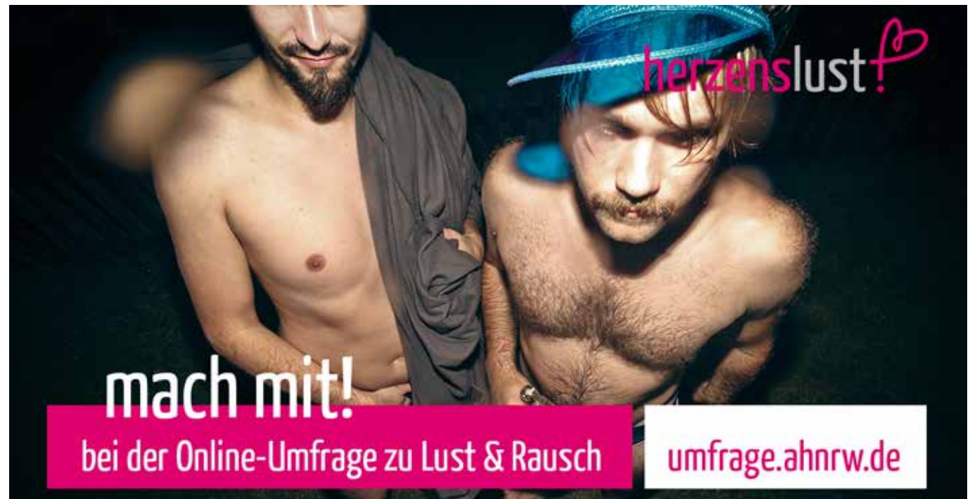
Online Umfrage Lust und Rausch, 2014

Andreas Bellmunt: Prävention darf sich nicht auf HIV beschränken, sondern muss auch Kenntnisse über alle anderen sexuell übertragbaren Erkrankungen vermitteln. Man muss zum Beispiel lernen, dass man sich immer wieder mit einer Syphilis oder mit Hepatitis C anstecken kann. So entsteht erst ein rundes Bild.