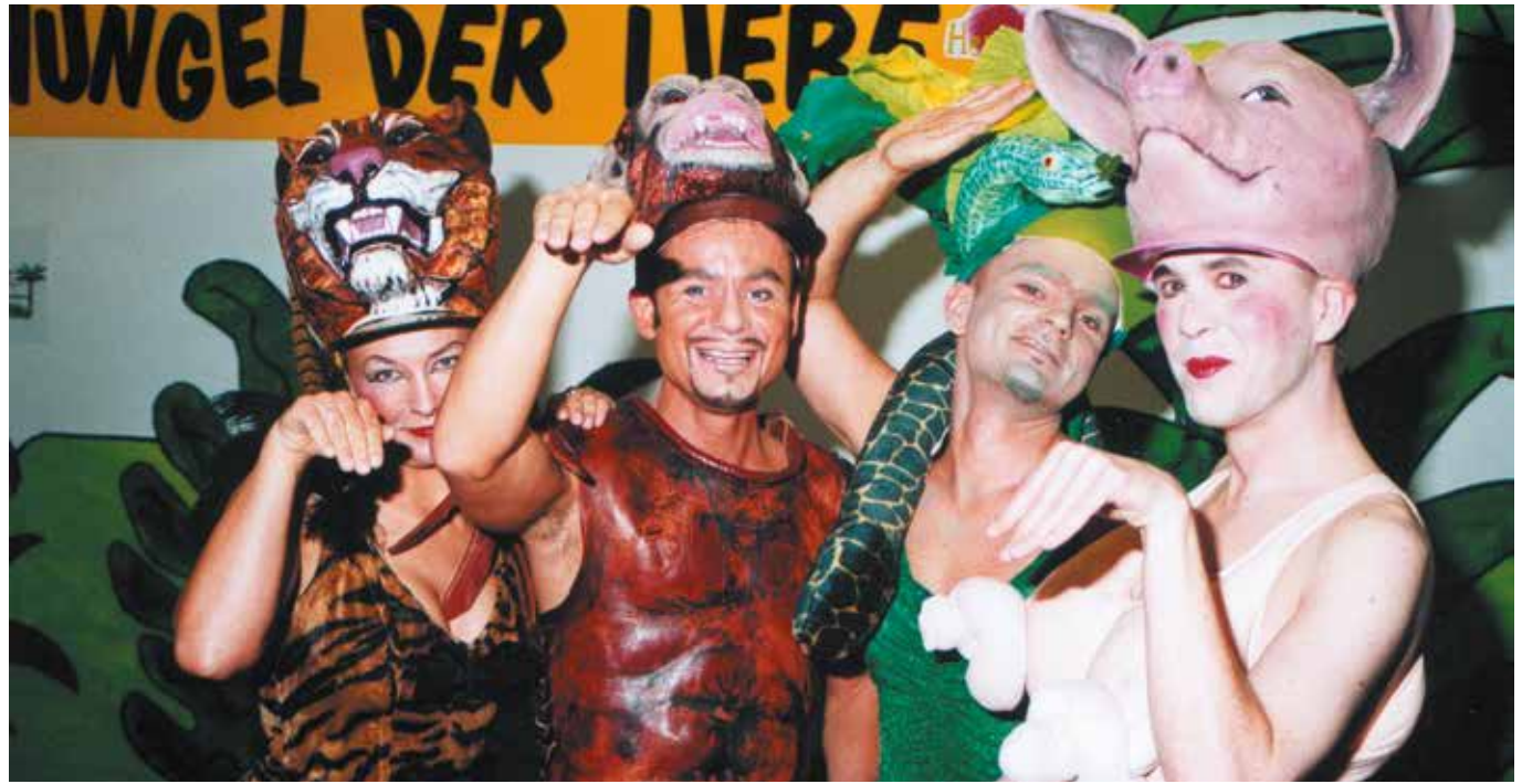
Dschungel der Liebe, CSD Köln, 1999

Ich hoffe mal sehr, dass es Herzenslust mit diesen Aufgaben in 20 Jahren nicht mehr geben muss, aber dass sich die Methode Herzenslust fortsetzt, in anderen Zusammenhängen, in anderen schwulen Lebenswelten.