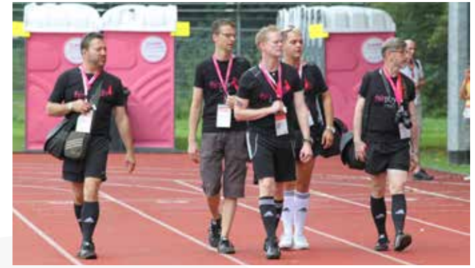
Gay Games, 2010, Köln