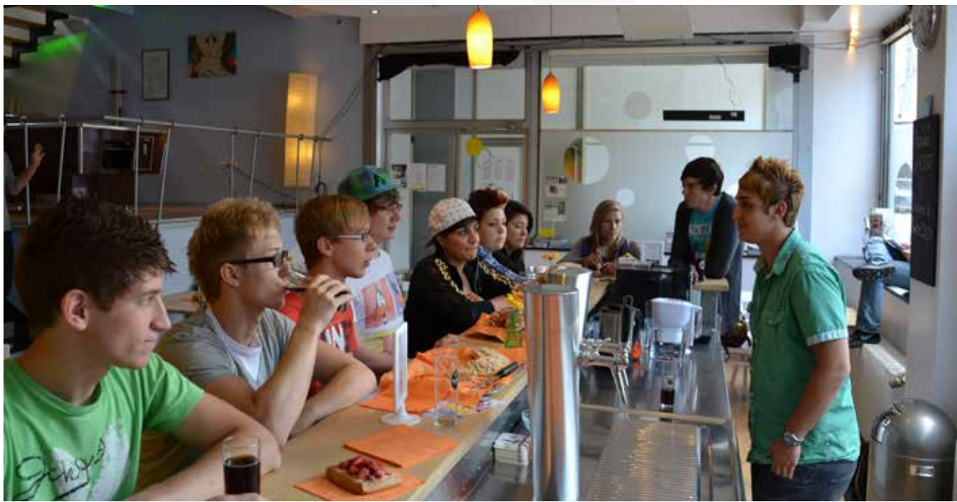
anyway Köln, 2011