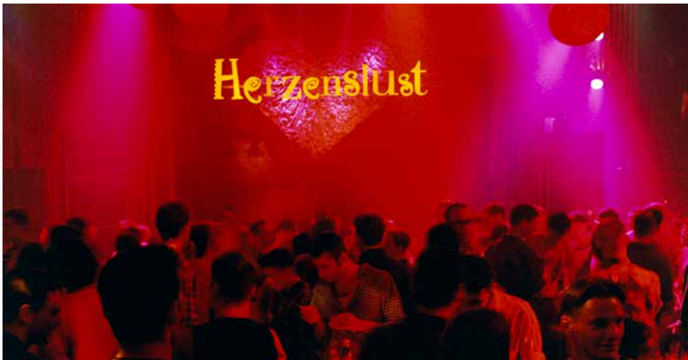
Auftakt Herzenslust-Kampagne im Gloria, 1995, Köln